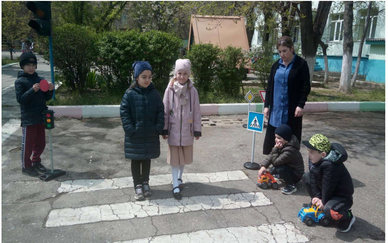
«Едем на зеленый свет»