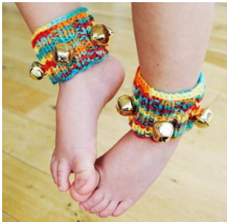
Колокольчики на ножка

извлекать деревянной палочкой (громкий, звонкий) или метелочкой для коктейля (шуршащий, легкий), проводя ее по трещотке сверху вниз.